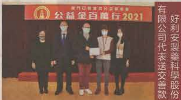
好利安製藥科學股份有限公司代表送交善款