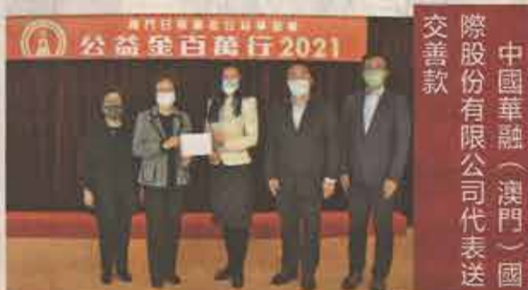
中國華融（澳門）國際股份有限公司代表送交善款