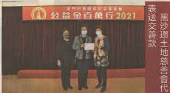
黑沙環土地慈善會代表送交善款