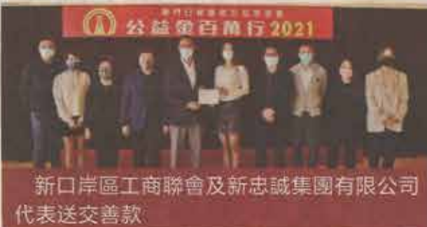
新口岸區工商聯會及新忠誠集團有限公司代表送交善款