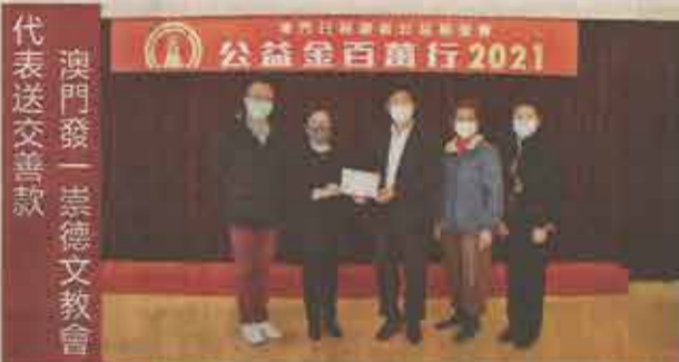
澳門發一崇德文教會代表送交善款