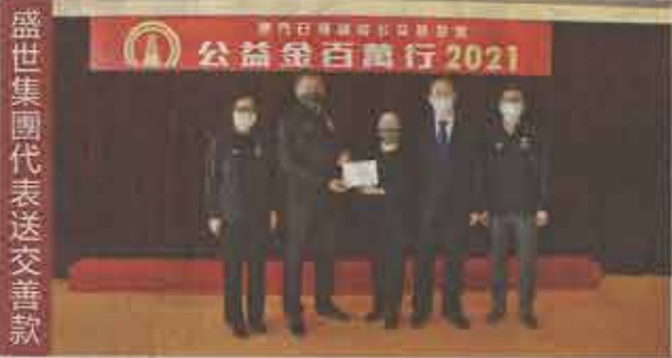
盛世集團代表送交善款