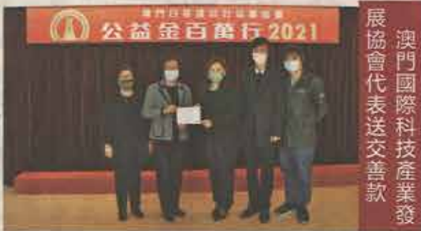
澳門國際科技產業發展協會代表送交善款

【本報消息】第三十八屆公益金百萬行明日以線上形式舉行，澳門日報讀者公益基金會昨續收到各界人士及團體交來善款，支持今屆百萬行。截至昨日，共收到善款一千六百九十八萬二千一百四十四元五角四分。