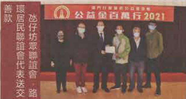
沙仔坊眾聯誼會代表送交善款