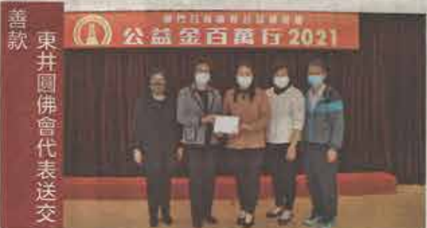
東井園佛會代表送交善款