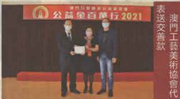
澳門工藝美術協會代表送交善款